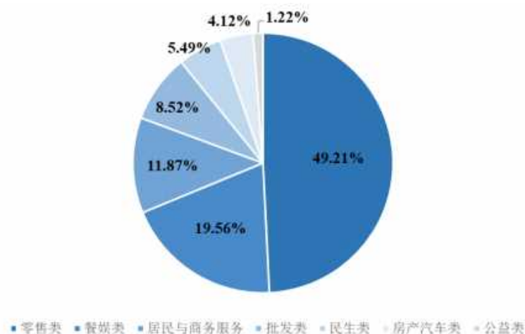
图 2：按商户规模划分，公司交易流水结构（截至 2022 年 12 月）